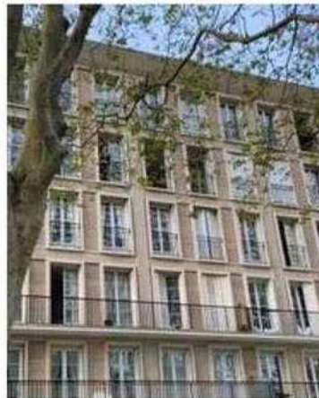
Les copropriétaires se trouvent face à l'enjeu de la rénovation énergétique

Il organise ainsi sa 7 e rencontre à destination du grand public afin qu'il puisse s'y retrouver dans le dédale juridique et réglementaire.