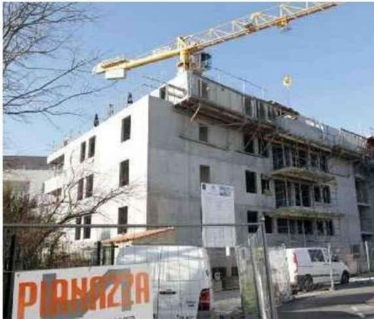
70 % des propriétaires bailleurs possèdent un logement, souvent de petite taille. « SUD OUEST »

constituer une incitation financière pour aider à investir et ainsi mettre à la disposition des usagers plus de logements. »