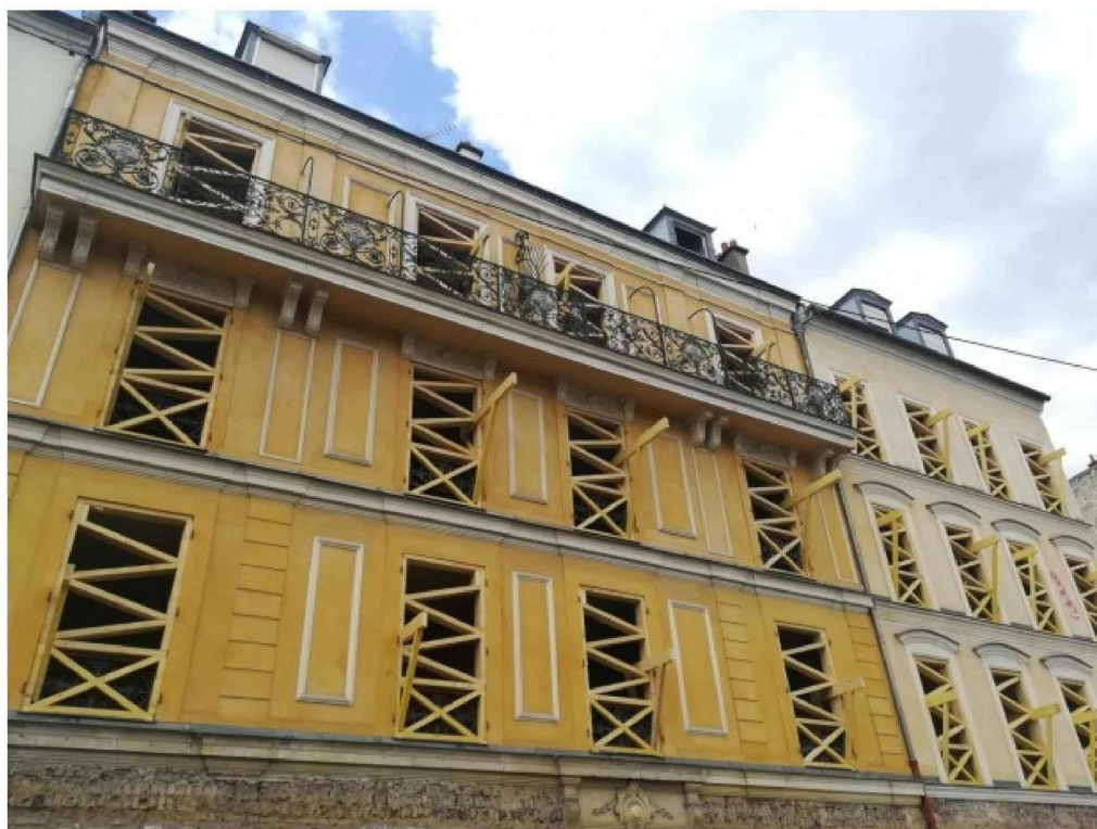
Rénovation copropriété réhabilitation

Florent Lacas, le 11/05/2022 à 15:35 Contenu réservé aux abonnés Batiactu+